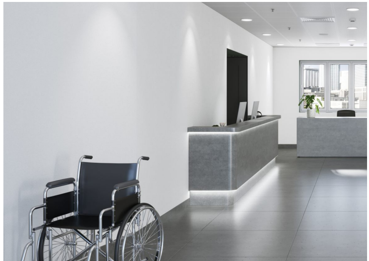
Dekor: Cool Grey