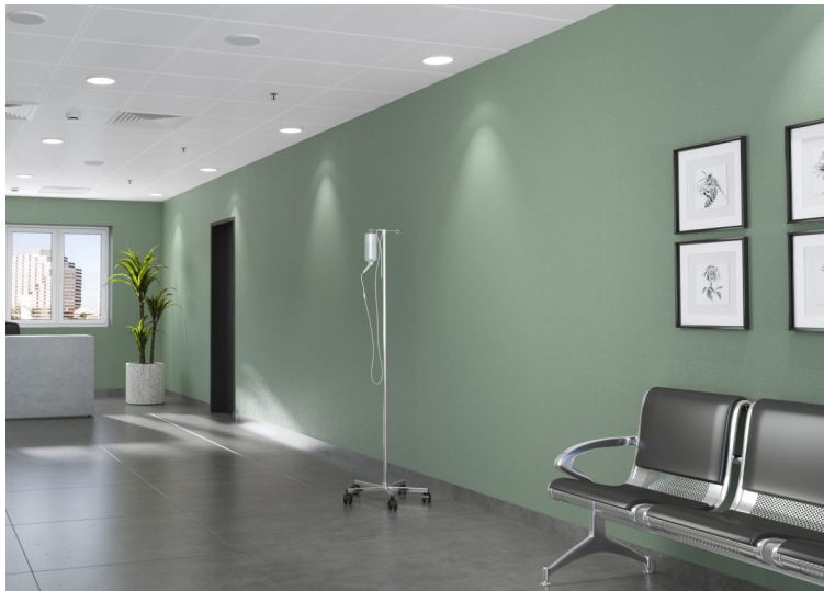
Dekor: Jade Green

*Panele wodoodporne do pomieszczeń mokrych Vito Fire Panel dostępne w ofercie od 2025.